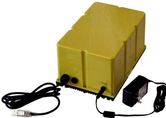
SCAN~LINK Desktop Tag Health Tester